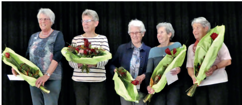
von Andrea Wanner

In der Mehrzweckhalle in Löhningen fand die 35. Jahresversammlung der Stöcklivereinigung statt, mit einem geschäftlichen Teil und den Ehrungen, sowie einem gemütlichen Ausklang.